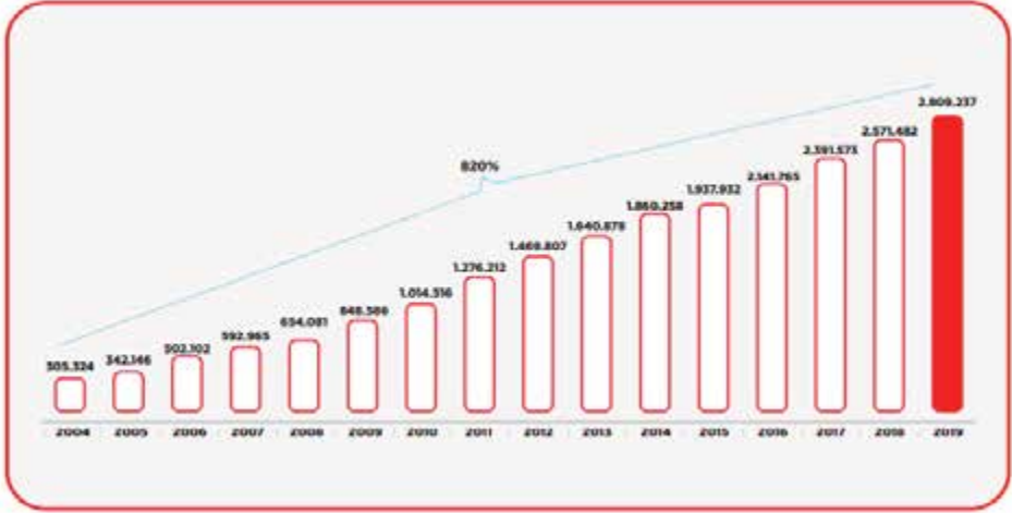
Şekil 1. 2004-2009 Yılları Kan Bağıış Sayısı (Türk Kızılay KHGM, 2019)